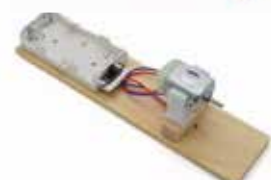
2 安裝電池盒和電機