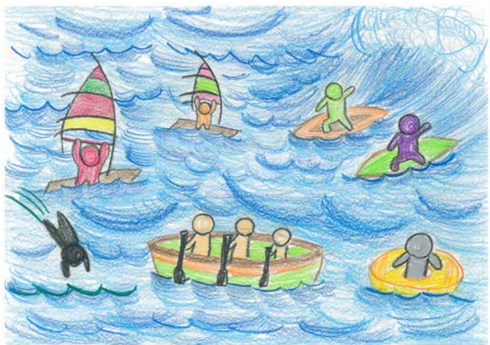
姓名：彭臻津 年齡：十一 年級：六年級